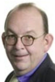
Denis Scheck