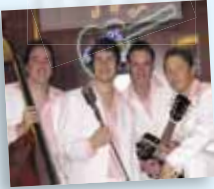
ROCK 'N' ROLL FLAMINGOS Rock 'n' Roll