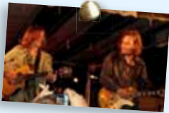
HOT PAPA'S Klassiker aus Rock und Pop sowie eigene Songs