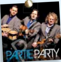
PARTIE PARTY Best of Party-Musik in sieben Sprachen